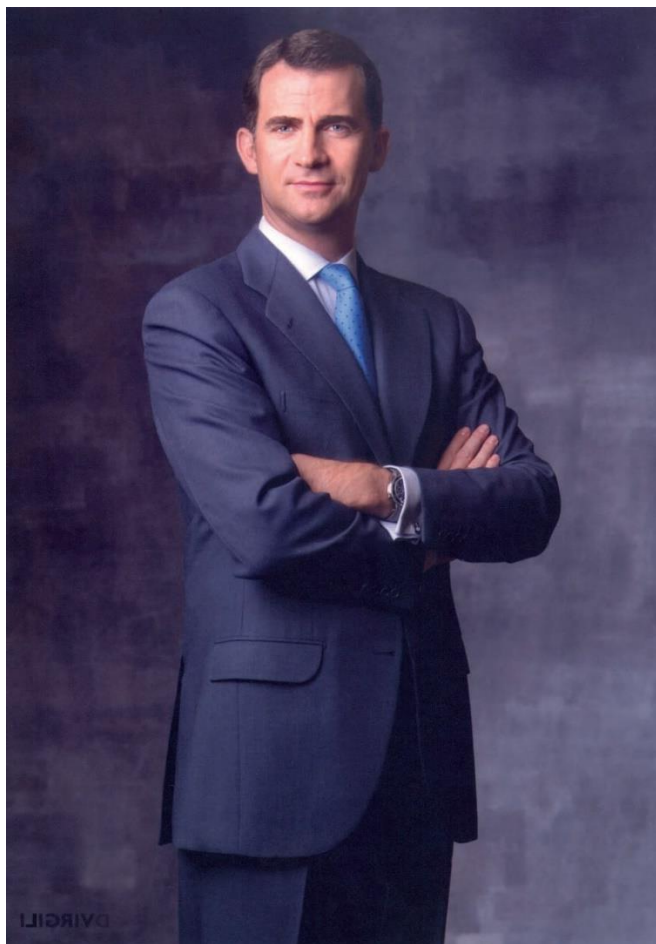
Presidente de honor S.M. el Rey