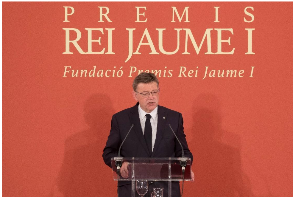
Molt Hble. Ximo Puig Presidente